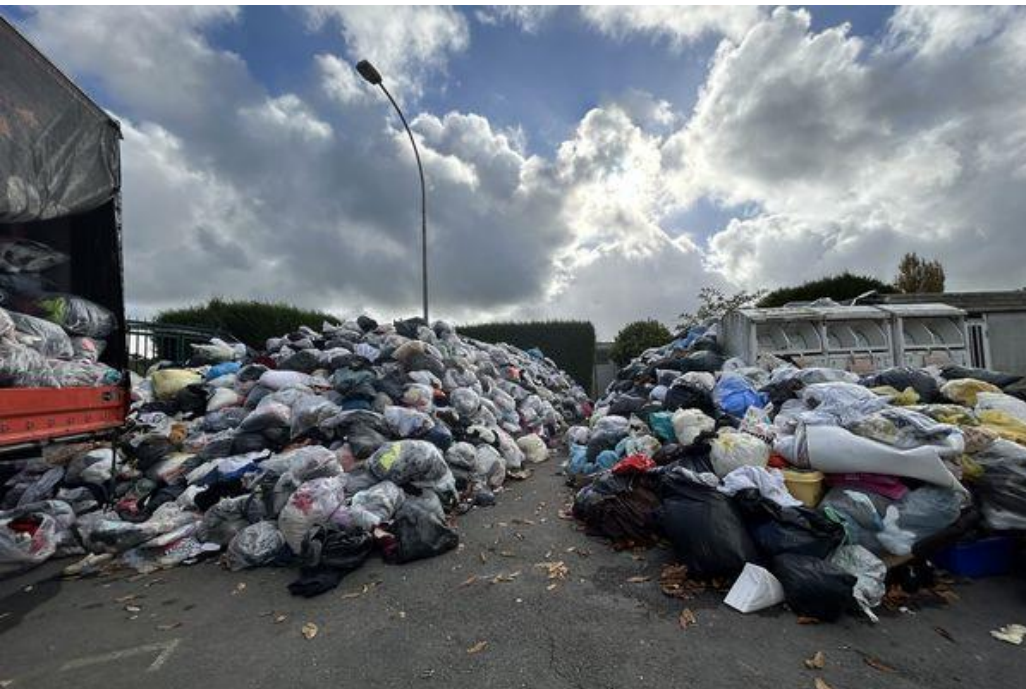
Montagne de sacs de vêtements à la déchèterie de Saint-Lô (Manche)